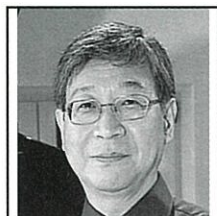
水野信行 Nobuyuki MIZUNO, cond. 指揮 [3/29]