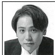
喜納和 Nagomu KINA, tn. テノール [3/27]