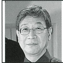
水野信行 Nobuyuki MIZUNO, cond. 指揮 (3/29)